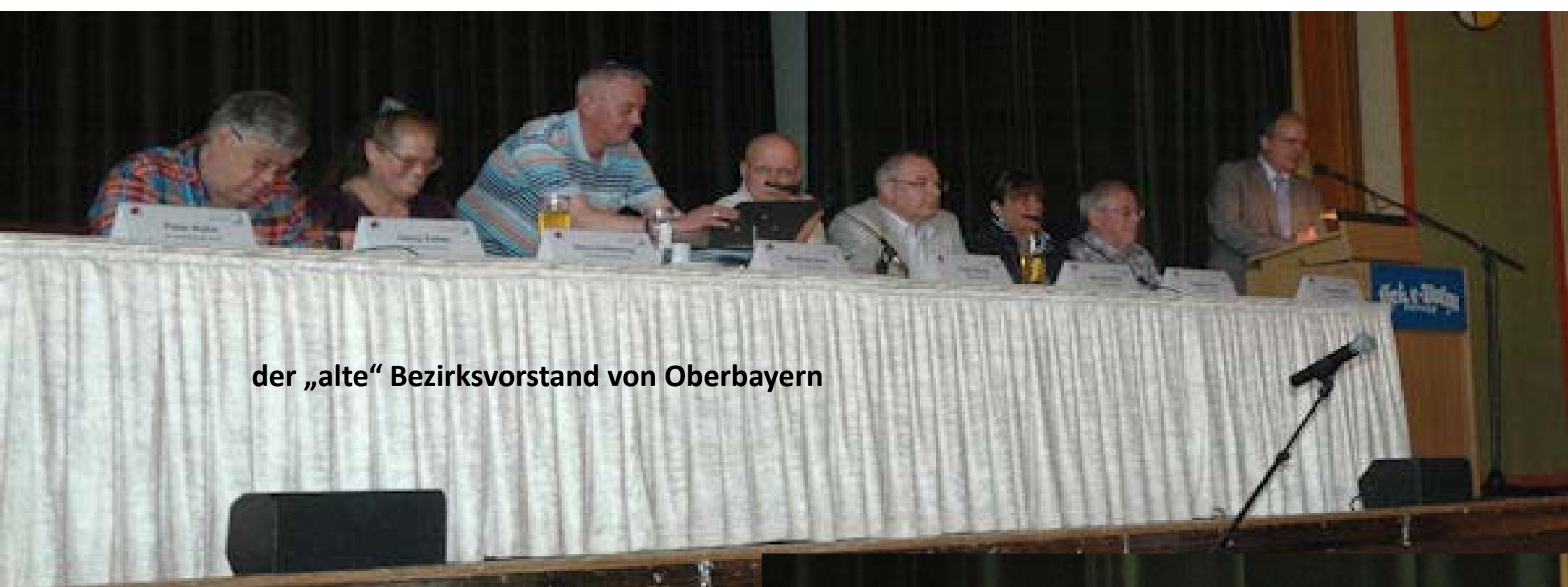
der „alte“ Bezirksvorstand von Oberbayern